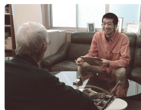
インタビュー風景

私たちの人生はキリストイエスにおいて造られた「創造主の作品」であり、家族や教会などたくさんの人々との関わりによって紡がれる「福音の物語」です。つまらない人生などひとつもありません。しかし、素晴らしいストーリーも、書く人がいなければ失われてゆくばかり。この機会に、自分史をつくりながら人生を振り返ってみませんか。